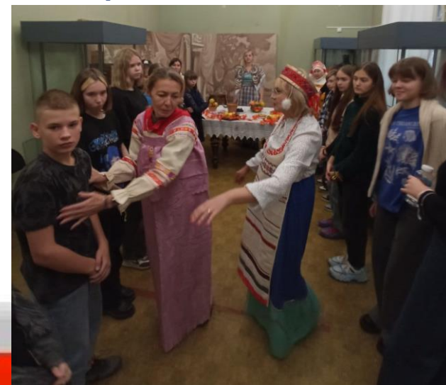
Игры народов Поволжья