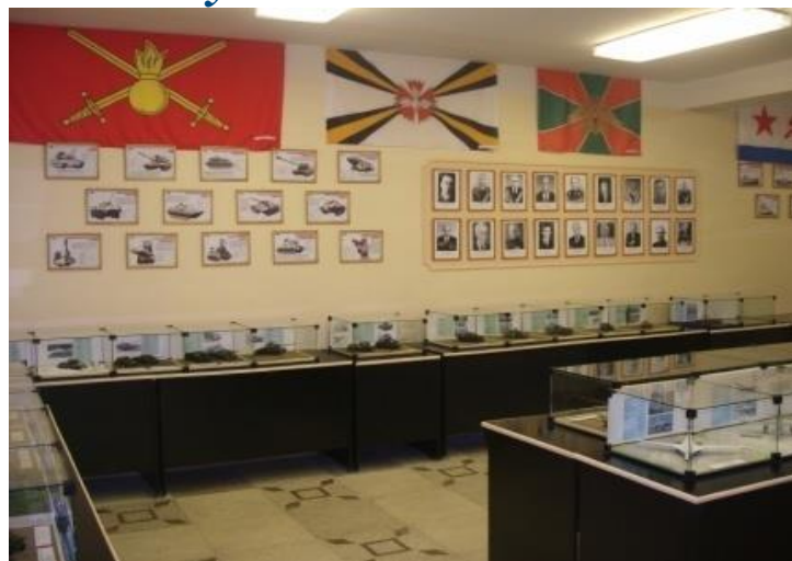
Экспозиция военной техники в миниатюре