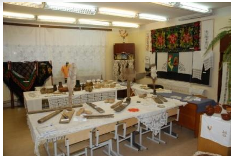
Комната Быт народов России