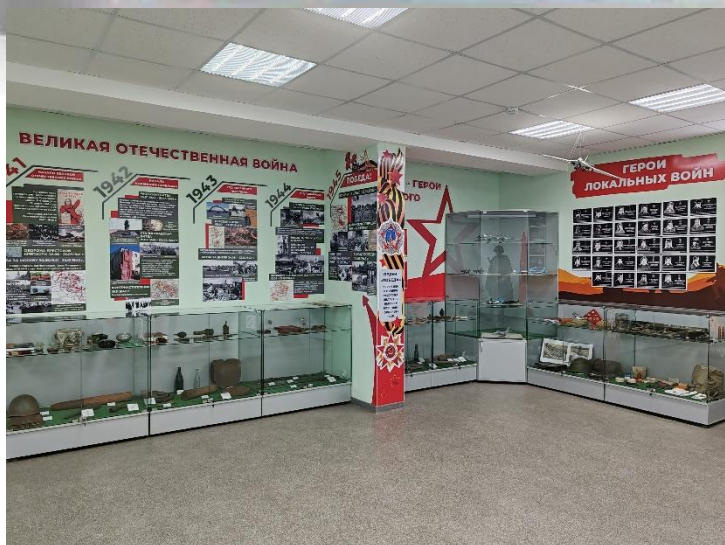
Музей Боевой Славы