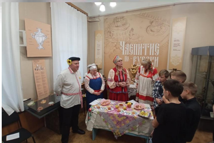
Святки в музее истории города