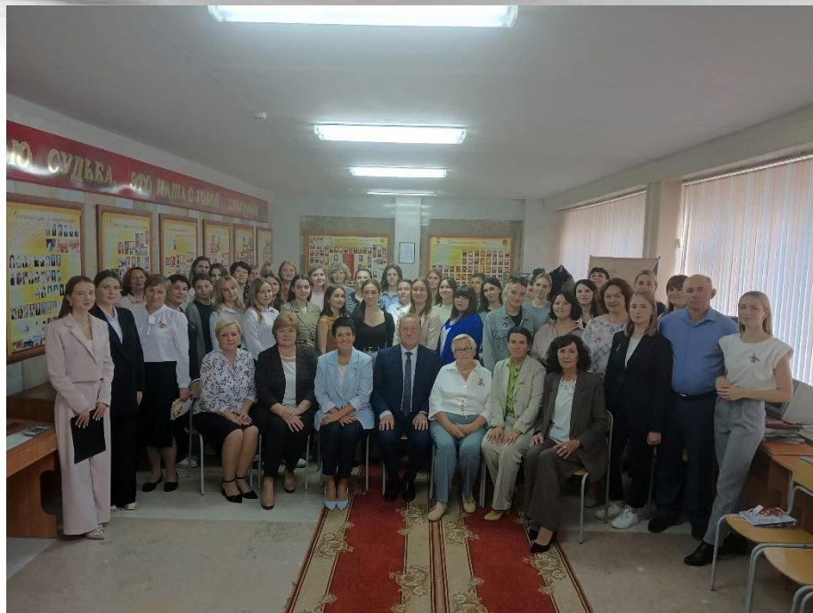
Творческая встреча педагогических династий и молодых педагогов