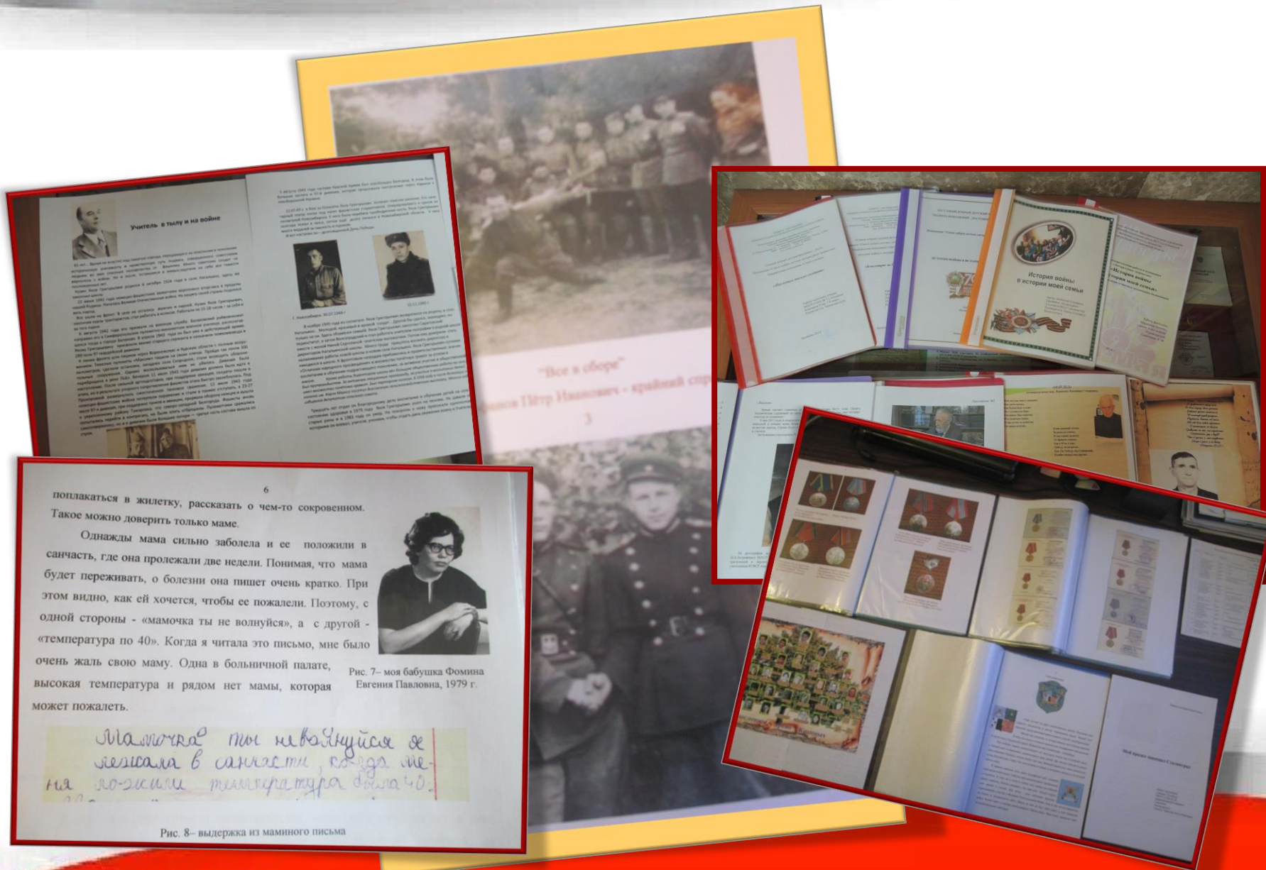
Рис. 8 – выдержка из маминго письма