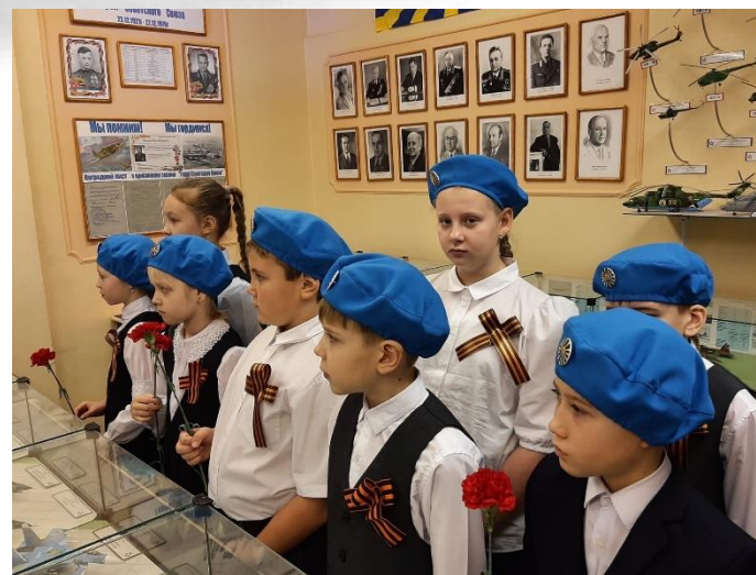
Шишкин Я.В. – Герой Советского Союза