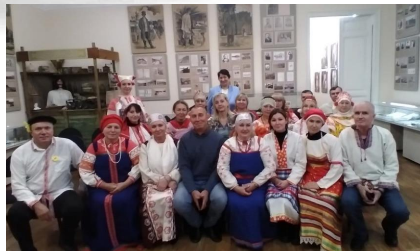
Фольклорные традиции народов России