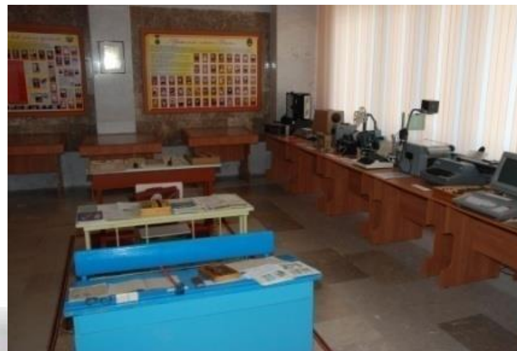
Экспозиция Летопись Балаковского образования